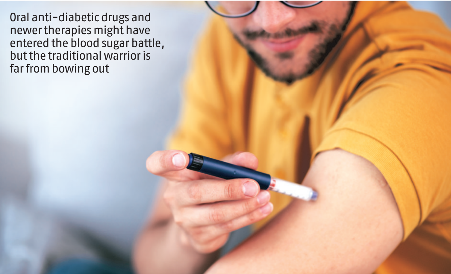
SOHINI DAS Mumbai, 5 May

Oral anti-diabetic drugs and newer therapies might have entered the blood sugar battle, but the traditional warrior is far from bowing out