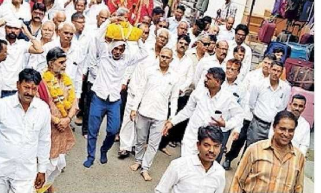
झालावाड़, शहर में सोमवार को निष्कर्षी श्रीमद्भागवत कथा की शोभायात्रा में मौजूद राठीर समाज के लोग।

झालावाड़। माध्यमिक शिक्षा बोर्ड अब परीक्षाओं को लेकर नया प्रणाली लागू करेगा। परीक्षा के बाद अब तक विद्यार्थियों को केवल री-टैलेंटिंग की सुविधा ही मिलती थी। बोर्ड अब री-कैंकिंग की सुविधा भी उपलब्ध करेगा। जानकारी के अनुसार इस बार इसकी प्रकट प्रोबेक्ट के तौर पर 10 वीं बोर्ड की गतिविधि में लागू किया जाएगा। सफल रहने पर अन्य विषयों में भी लागू किया जाएगा। शिक्षा मंत्री के निदेश के बाद बोर्ड ने इसके लिए नियम में संशोधन की प्रक्रिया प्रारंभ कर दी है।