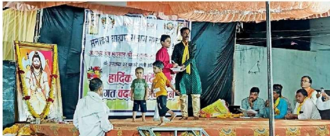
मालपुर, सनाढ्य ब्राह्मण समाज के कार्यक्रम में प्रस्तुति देने वाले बच्चे व अन्य प्रतिभागों को सम्मानित किया गया।

सनाढ्य ब्राह्मण समाज युवा समिति के तत्त्वधान में रविवार शाम भगवान परशुराम का जन्मोत्सव धूमधाम से मनाया गया। चाटाकुंडी बालाजी मंदिर से शोभायात्रा की शुरुआत हुई। रात्रि पर भगवान परशुराम की सजीव झांकी सजाई गई थी। बौद्धात्मा की धुन पर युवा थिरकते हुए आगे बढ़े। यत्रा नगर के प्रमुख मार्गों से निकली। लोगों ने पत्तों के सामने भगवान परशुराम की पूजा की जगह-जगह पुष्पधारा की गई।